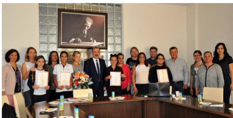
Российский Центр культуры и науки. Анкара, Турция.

Вручение сертификатов – это праздничная церемония, которая вдохновляет детей на новые успехи в изучении русского языка.